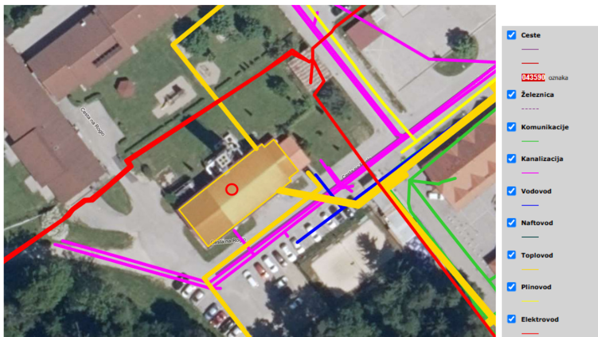
Slika 3: Prikaz gospodarske javne infrastrukture na obravnavanem območju