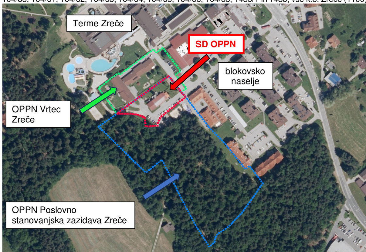
Slika 1: Prikaz obravnavanega območja

Območje sprememb in dopolnitev je velikosti ca. 31 ara in zajema zemljišča s parc. št. 104/5, 104/26, 104/35, 104/61, 104/62, 104/63, 104/64, 104/65, 104/66, 104/68, 1455/1 in 1483, vse k.o. Zreče (1100).